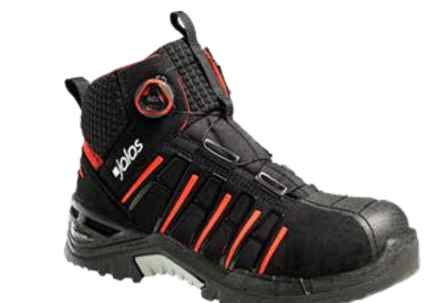
SKOLETT JALAS 9985 EXALTER S3 0-9985-0-10

ESD-godkänd skolett med överdel av mikrofiber och textil. Lätt och rymlig, samtidigt som den snabbt och enkelt kan tas av och på med sidmonterat BOA®-snörningssystem. Passar utmärkt för användning i miljöer där vassa föremål kan förekomma och i rena miljöer.