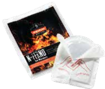
TÅVÄRMARE N-FERNO® 6992 PAR 0-75601-6992-98

Värmepaket som hjälper till att hålla tårna varma i kylan. Lägg värmepaketet i skodonet och håll dig varm i upp till 6 timmar.