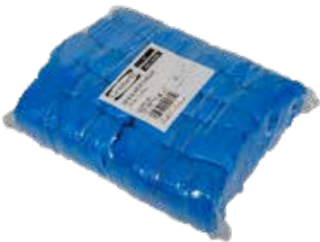
SKOÖVERDRAG Å 100 0-75100-21060-45

Engångs-skoskydd i CPE-plast, 16"". Tjocklek 36 my. Passar för användning på byggplatser och anläggningar, inom vaktmästeri, labb och apoteksverksamhet. Vikt 4,4 g/st.