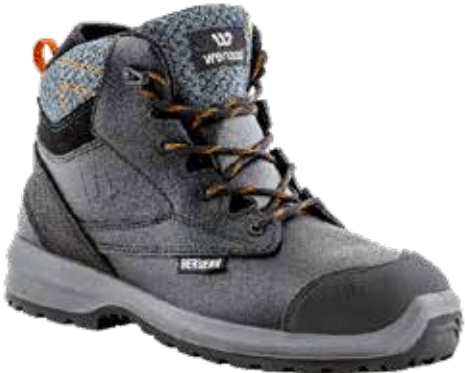
SKOLETT WENAAS BERSERK BURR S3 0-75-957-10

ESD-godkänd skolett med andningsaktivt 3D mesh textilfoder och snörning. Mycket bekväm med utmärkta halkskyddande och stöt-dämpande egenskaper.