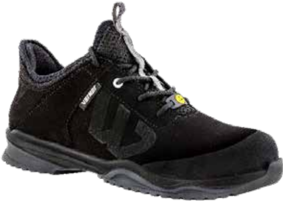
SKO WENAAS CALYPSO S3 0-14200-0-10

Traditionell sko med modern design med en överdel av mikrofiber. ESD-godkänd, lätt och metallfri med mjukt spiktrampskydd gör att skon upplevs som mycket bekväm att bära. Bekväm och uttagbar Work Comfort EVO innersula.