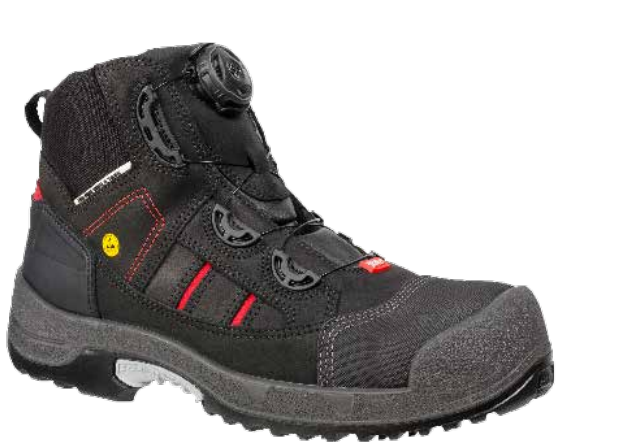
SKOLETT JALAS 1718 ZENIT S3 0-1718-0-10

Solid ESD-godkänd skolett med överdel av PU-belagt läder och PU/PU-yttersula med god stötdämpning och fotledsstöd. Rymlig och bekväm passform, samtidigt som den genom BOA®-snörningssystemet snabbt kan tas av och på. Passar bra för användning i miljöer där vassa föremål kan förekomma.