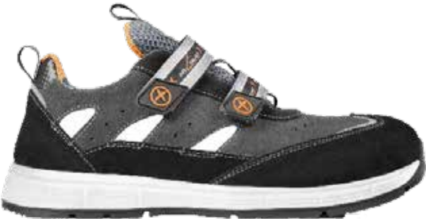
SANDAL JOHN S1P 0-1100-5203-10

Lätt och sportig sandal med modern design. Mycket bekväm fotbädd på grund av bra vaddering och andningsaktiv innersula.