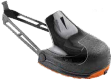
SKYDDSGALOSCH MILLENIUM PREM PAR 0-9316-1500-10

Rymlig, lätt och metallfro besöks-galosh med tåhatta i komposit för användning ovan en vanlig sko. Plös för bästa skydd. Belagd med TPU och med en justerbar rem att fästa bakom hälen. Används av besökande eller för korta vistelser där skyddsskor krävs. Kan tvättas med en mjuk borste eller en fuktig trasa med lite diskmedel.