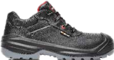
SKO EXENA HAMILTON S3 0-1271-1205-10

Lätt och rymlig sko med överdel av läder och behagligt innerfoder. Passar utmärkt för yrken där S3-skor krävs. FÄRG 10 Svart STORLEK 35-48 STANDARD EN ISO 20345:2011, S3 SRC MATERIAL Överdel: Läder. Yttersula: PU/PU. Spiktrampskydd: Mjukt. Foder: Textil. Tåhätta: Komposit.