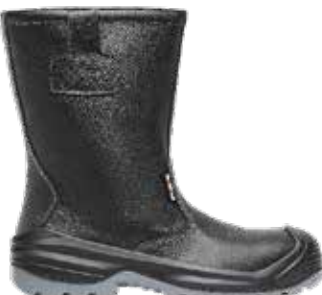
STÖVEL EXENA TERRANOVA S3 SRC 0-1671-1205-10

Stövel med ovandel i läder, ofodrad. Bekväm PU/PU-sula. Lätt, rymlig, metallfri och antistatisk stövel med tåhätta i komposit och mjukt nagelskydd. Uttagbar innersula. FÄRG 10 Svart STORLEK 35-48 STANDARD EN ISO 20345:2011, S3 SRC MATERIAL Ovandel: Läder. Yttersula: PU/PU. Nagelbana: Mjuk. Skyddstå: Komposit