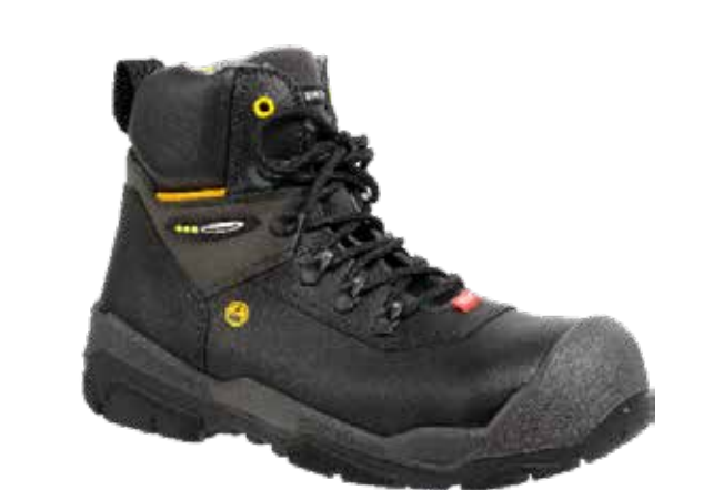
SKOLETT JALAS 1828 JUPITER S3 0-1828-0-10

Solid ESD-godkänd skolett med överdel i PU-belagt läder. Mycket bekväm stövel tack vare den bra passformen. Passar utmärkt för helårsanvändning i utomhusmiljöer och för krävande miljöer, där vassa föremål kan förekomma.