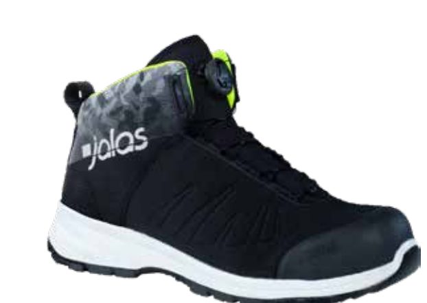
SKOLETT JALAS 7178 ZENITEVO S3 0-7178-0-10

ESD-godkänd, lätt och sportig skolett med en överdel av stickad textil och slitagedelar i plast. Skoletten är mycket bekväm och har en rymlig passform och kan genom BOA®-snörningssystemet snabbt tas av och på.