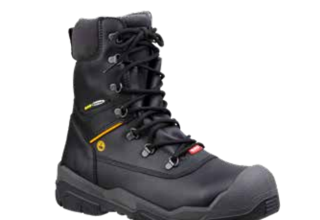
STÖVEL JALAS 1878 OFFROAD S3 0-1878-0-10

Solid ESD-godkänd vinterstövel med överdel i PU-belagt läder och underbart fleecefoder. Mycket bekväm stövel på grund av den goda passformen. Passar utmärkt för helårsanvändning i utomhusmiljöer och för krävande miljöer, där vassa föremål kan förekomma.