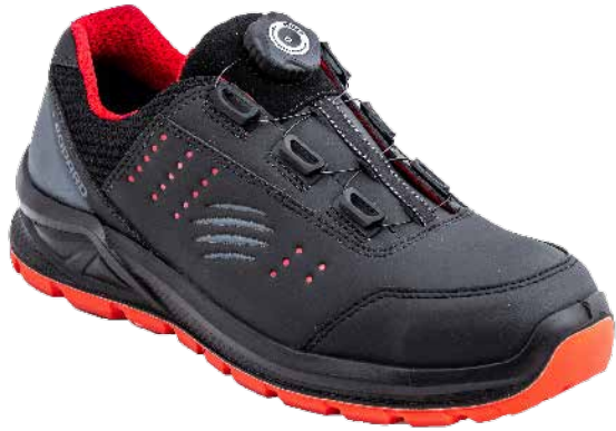
SKO LEOPARD 1431 S3 0-1431-0-10

Bekväm sko med extra bred läst, mjukt läder och A-Top snabb-snörningssystem för att enkelt och snabbt kunna ta på och av skoletten. På grund av den asymmetrisk tåhättan känns den här skoletten rymlig och bra.