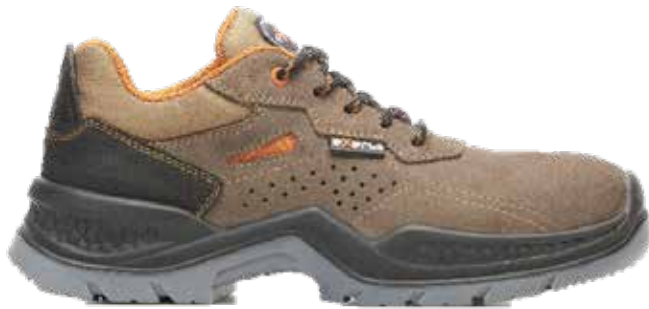
SKO EXENA CUBA S1P 0-1272-1205-50

Bekväm, lätt och rymlig sko med överdel av mocka och PU/PU-sula. Skon är metallfri och antistatisk.