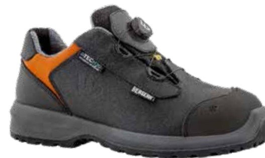
SKO WENAAS BERSERK GILBY S3 0-1220-1101-10

ESD-godkänd, vattentät och andningsaktiv sko i modern design med snabbsnörning, överdel av högkvalitativt fullnarvsläder och en lätt, mjuk yttersula i gummi/PU. Mycket bekväm sko med utmärkta halkskyddande, stötdämpande och avlastande egenskaper.