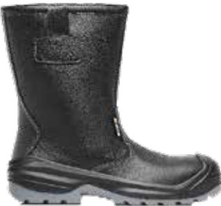
STÖVEL EXENA TERRANOVA S3 CI 0-1571-1205-10

Lätt och bekväm vinterstövel med pälsfoder. Enkel att ta på sig, med öglor på sidan för att dra på den. Uttagbar innersula. FÄRG 10 Svart STORLEK 35-48 STANDARD EN ISO 20345:2011, S3 CI SRC MATERIAL Överdel: Läder. Yttersula: PU/PU. Spiktrampskydd: Mjukt. Foder: Päls. Tåhätta: Komposit.