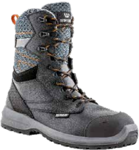
STÖVEL WENAAS BERSERK BORG S3 0-75-955-10

ESD-godkänd stövel med andningsaktivt 3D mesh textilfoder, samt snörning och blixtlås i sidan. Mycket bekväm med utmärkta halk-skyddande och stötdämpande egenskaper.