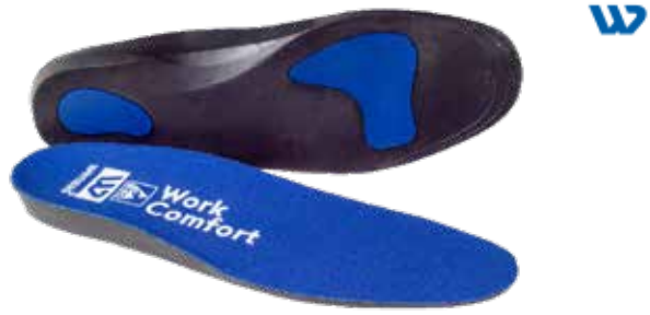
SULA WENAAS WORK COMFORT 0-81-293-45

Wenaas Work Comfort dubbel ESD-gelsula med utmärkt stötdämpande effekt. Motverkar trötthet och smärtor i fötterna och är specialutvecklad för arbetsskor som används hela arbetsdagen. Sulan har klipplinjer så att du kan anpassa den till korrekt storlek.