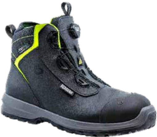
SKOLETT WENAAS BERSERK LOKE EH 0-1240-0-10

Elisolerande, vattentät och andningsaktiv skolett med överdel av hög-kvalitativt fullnarvsläder och A-Top snörningssystem. Mycket bekväm stövel med lätt, mjuk yttersula i gummi/PU samt utmärkta halkskyddande och stötdämpande egenskaper.