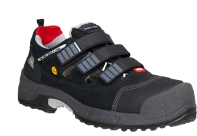
SANDAL JALAS 3008 ZENIT S1P 0-3008-0-10

ESD-godkänd sandal med PU-belagt läder. Lätt, luftig och rymslig. De tre kardborrstängningarna är snabba att ta av eller på. Passar bra för användning i miljöer där vassa föremål kan förekomma.