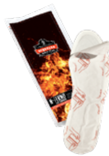
FOTVÄRMARE N-FERNO® 6995 PAR 0-75602-6995-98

Värmepaket som hjälper till att hålla fötterna varma i kylan. Lägg värmepaketet i skodonet och håll dig varm i upp till 6 timmar. Fotuppvärmningspaketet N-Ferno® innehåller två självhäftande sulor. Alla ingredienser värms upp när de kommer i kontakt med syre. Passar för skor eller stövlar i storlek 41 och större. Kan inte klippas för att anpassas.