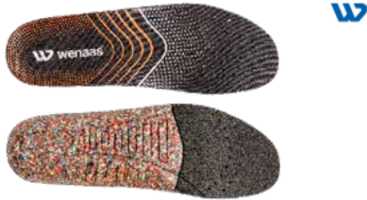
SULA WENAAS WORK COMFORT EVO 0-9003-1000-98

Iläggssula med bra dämpning som ger avlastning vid statiskt och dynamiskt arbete. Sulan har extra vadderung där tåns undersida möter sulan för extra bra komfort. Fuktabsorberande material som gör att sulan torkar snabbt. Både sulan och förpackningen är producerad av återvunnet material. Sulan är tvättbar.