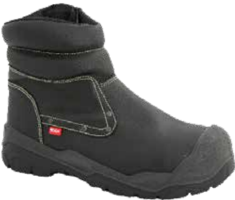
SKOLETT JALAS 1848K TITAN S3 0-1848-0-10

Solid skolett med överdel av PU-belagt läder och gummi-/PU-yttersula med god stötdämpning och fotledsstöd. Fodrad med behaglig Cambrelle® och Thinsulate och god passform gör den bekväm att bära. Sömmar med kevlartråd som tål kortvarig värmeexponering på 427 °C och 204 °C värme-exponering under en längre tid. Passar för helårsanvändning med varma ytor och metallproduktion, samt i miljöer där vassa föremål kan förekomma.