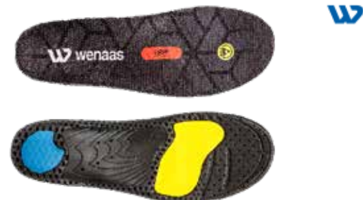
SULA WENAAS WORKPRO LÅGT FOTVALV 0-9000-1000-98

ESD-iläggssula för statiskt och dynamiskt arbete med anpassning för individuellt fotvalvsstöd. Den här sulan är avsedd för lågt fotvalv. Ergonomisk design för att reducera trötthet i fötterna.