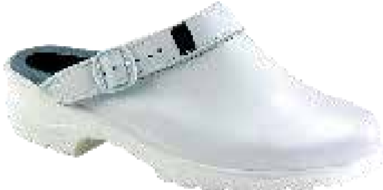
CLOGS EMBLA & ASK OB 0-8523-0-40

Klassiska clogs med PU-läderöverdel och oljebeständig yttersula. Rymlig modell, ventileringshål i sidan och vadderad fotbädd ger hög komfort. Vändbar hälrem gör dessa clogs mycket praktiska. Passar för användning på laboratorier, läkarmottagningar, inom livsmedelsindustrin och dylikt.