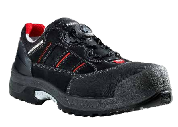
SKO JALAS 1738 ZENIT S3 0-12503-1738-10

Solid ESD-godkänd sko med god passform och en överdel av PU-belagt läder och PU/PU-yttersula med god stötdämpning och fotledsstöd. BOA®-snörningssystem gör att skon snabbt kan tas av och på. Passar bra för användning i miljöer där vassa föremål kan förekomma.