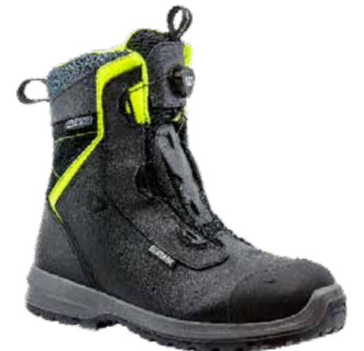
STÖVEL WENAAS BERSERK BRAGE EH 0-1270-0-10

Elisolerande, vattentät och andningsaktiv stövel med överdel av högkvalitativt fullnarvsläder och A-Top snörningssystem. Mycket bekväm stövel med lätt, mjuk yttersula i gummi/PU samt utmärkta halkskyddande och stötdämpande egenskaper.