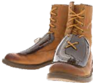
METATARSALSKYDD MELTGUARD 0-93-3500-10

Skyddar fotens fotens metatarsalområde. Designad för att komplettera skodon med stålhatta. Tillverkad av extremt hållbart och lätt polykarbonatmaterial. Säkras med existerande skosnören eller extra snören tillgängliga för skodon utan skosnören. Kan användas på en mängd arbetsplatser inom industri, gruvedrift, bygg och anläggning, produktion, transport, skogsbruk, varuhandel och lagerhållning.