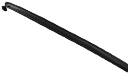
SKOHORN I PLAST SVART 79 CM 0-9300-3300-98

Skohorn i plast, svart 79 cm. Det långa skaftet är en god hjälp när man ska ta på skorna. Skohornet är behagligt att hålla i, samtidigt som det är användarvänligt. Det kan praktiskt taget hängas upp på väggen.