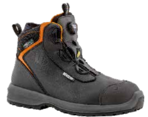
SKOLETT WENAAS BERSERK BORR S3 0-1320-1101-10

ESD-godkänd, vattentät och andningsaktiv skolett i modern design med snabbsnörning, överdel av högkvalitativt fullnarvsläder och en lätt, mjuk yttersula i gummi/PU. Mycket bekväm skolett med utmärkta halkskyddande, stötdämpande och avlastande egenskaper.