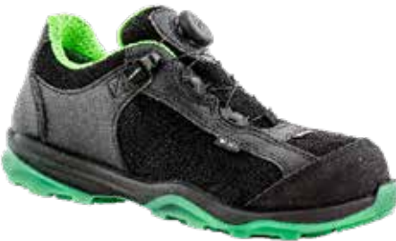
SKO PRO RUN S3 0-76-850-10

Vattentät och andningsaktiv sko, fodrad med W-TEX-membran. Lätt, stabil och sportig sula med stöd, i PU/PU som ger ett mycket bra grepp. A-Top snörningssystemet gör det enkelt att snabbt ta på och av skorna.