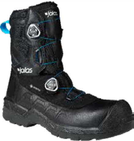
STÖVEL JALAS HEAVY DUTY GTX S3 0-1398-0-10

Vinterstövel med överdel av fullnarvsläder och textil, samt vattentätt Gore-Tex-membran. Stöveln har extra varmt påsfoder som isolerar särskilt bra mot kyla. Bekväm Vibram® Arctic Grip Pro PU-/gummisula som ger ett bra grepp på våt snö och is. Rymlig läst med mjukt spiktrampskydd och komposit-tåhätta, samt dubbelt BOA®-snörningssystem för perfekt justering i två zoner. Uttagbar innersula.