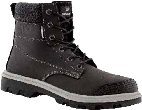
SKOLETT WENAAS HIBERNIA S3S 0-6060-0-10

Skolett i traditionell design med överdel av fullnarvsläder. Skoletten har en ikonisk och flexibel yttersula med utmärkta halkskyddande egenskaper och fotledsstöd, tåhäтта och mjukt spiktrampskydd.