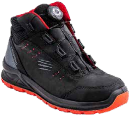
SKOLETT LEOPARD 1430 S3 0-1430-0-10

För den som behöver extra stora storlekar kan vissa modeller i Leopard-kollektionen fås i storlekar upp till storlek 54.