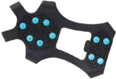
BRODD WALKING 0-9901-7000-10

Allsidig brodd av TPE som kan brukas i alla väderförhållanden. Enkel att ta av och på och ger ett bra fäste på snö och is. Utrustad med nitlar i metall, 6 fram och 4 bak.