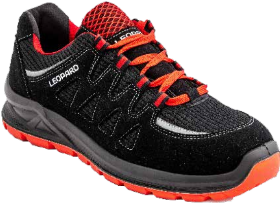
SKO LEOPARD 1673 S1P 0-1673-0-10

Sportig sko med extra bred läst, överdel av mikrofiber och andningsaktivt textilmaterial. På grund av den asymmetrisk tåhättan känns den här skoletten rymlig och bekväm.