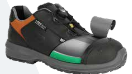
Andra skomärkens tekniker