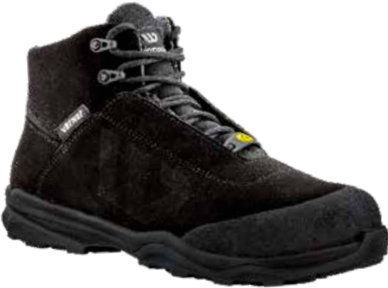
SKO WENAAS SCOTIA S3 0-14300-0-10

Traditionell skolett med modern design och överdel av mikrofiber. ESD-godkänd, lätt och metallfri med mjukt spiktrampskydd gör att skon upplevs som mycket bekväm att bära. Bekväm och uttagbar Work Comfort EVO innersula.