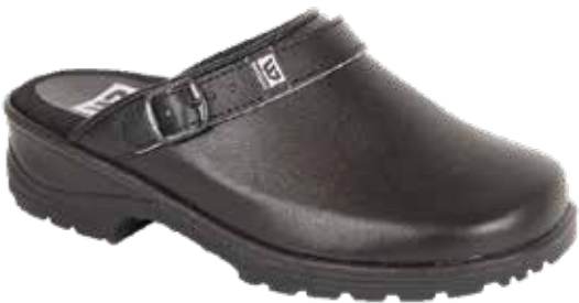
CLOGS EMBLA & ASK OB 0-8523-0-10

Klassiska clogs med PU-läderöverdel och oljebeständig yttersula. Rymlig modell, ventileringshål i sidan och vadderad fotbädd ger hög komfort. Vändbar hälrem gör dessa clogs mycket praktiska. Passar för användning på laboratorier, läkarmottagningar, inom livsmedelsindustrin och dylikt.