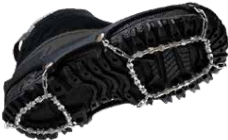
BRODD DIMOND GRIP 0-9902-7000-98

Brodd Yaktrax Diamond Grip ger ett suveränt fäste på alla slags underlag, från blank is till djup lössnö. Tillverkad av stålkel och härdad stål, kombinerat med de patenterade diamanterformerna som greppar tag i underlaget. Bekväm vid användning undre längre tid. Passar utmärkt för användare som arbetar på ytor bestående av sten, smuts och betong.