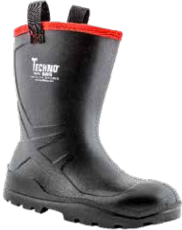
STÖVEL PU TECHNO RIGGER S5 0-9502-0-10

Allroundstövel i PU-material, rigger-modell med pådragningsöglor. Utmärkt stötdämpning och låg vikt ger hög komfort. Stöveln har XtremeGrip TPU/PU-sula. Resistent mot mineraler, djur- och plantbaserade oljor, fett, desinfektionsmedel, gödsel, lösningsmedel och olika kemikalier. FÄRG 10 Svart STORLEK 36-49 STANDARD EN ISO 20345:2011, S5 SRC MATERIAL Överdel: PU. Yttersula: TPU/PU. Spiktrampskydd: Stål Tåhäätta: Stål.