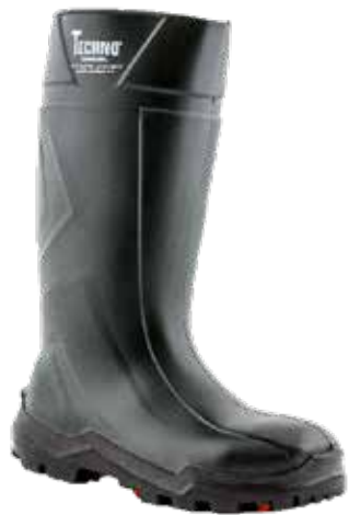
STÖVEL PU TECHNO JOBMASTER+ S5 0-9503-0-15

Allround, hög PU-stövel som kan vikas ned. God stötdämpning och låg vikt ger hög komfort. Stöveln är resistent mot mineraler, animaliska oljor, plantbaserade oljor och fett, desinfektionsmedel, gödsel, lösningsmedel samt olika kemikalier. FÄRG 15 Grön STORLEK 36-49 STANDARD EN ISO 20345:2011, S5 SRC MATERIAL Överdel: PU. Yttersula: TPU/PU. Spiktrampskydd: Mjukt, metallfritt. Tåhäätta: Komposit.