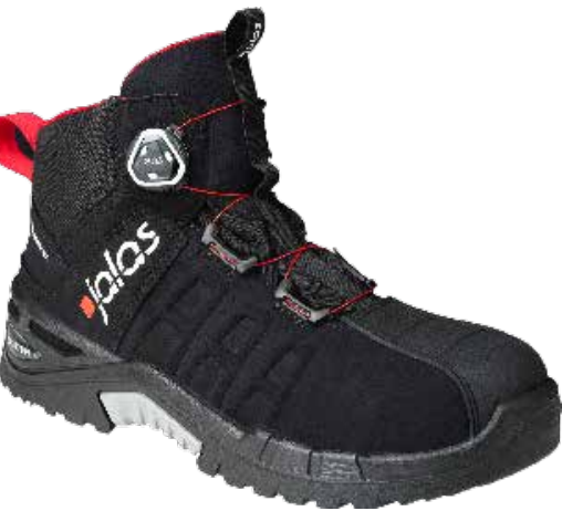
SKOLETT JALAS EXALTER GTX S3 0-9988-0-10

Skolett med överdel av mikrofiber och vattentätt Gore-Tex-membran och bekväm Vibram® PU-/gummisula med utanpåliggande plastled. Lätt, rymlig och snabb att ta av och på med BOA® snörningssystem. Passar för fuktiga och våta arbetsmiljöer.