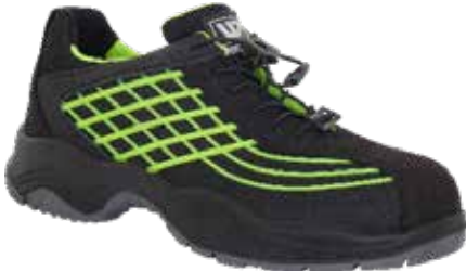
SKO SPIDER 3 0-72-820-10

Skor med ovandel i mikrofiber och tuffa kontrastfärger. Snörning med enkel spännmekanism. TPU/PU-sula med bra dämpning. Aluminium-tåhätta för bättre skydd och med en tunnare design. Mjukt spiktrampskydd. ESD godkänd. Wenaas Workpro-sulsystemet från Currex är godkänt för användning med denna modell. Uttagbar innersula. Levereras med ett extra set skosnören.