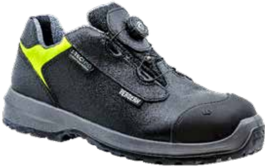
SKO WENAAS BERSERK TYR EH 0-1250-0-10

Elisolerande, vattentät och andningsaktiv sko med överdel av hög-kvalitativt fullnarvsläder och A-Top snörningssystem. Mycket bekväm stövel med lätt, mjuk yttersula i gummi/PU samt utmärkta halkskyddande och stötdämpande egenskaper.