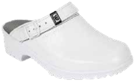
CLOGS MUNIN & HUGIN SB 0-8522-0-40

Klassiska och bekväma clogs med tåhätta och vändbar hälrem. Rymlig modell med ventileringshål i sidan.