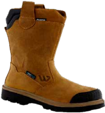
STÖVEL WENAAS BAKKEN S3 0-9060-0-50

Skaftstövel i traditionell design med överdel i fullnarvat läder och med vattentätt membran. Den lätta och flexibla yttersulan är ikonisk och ger ett mycket bra grepp.