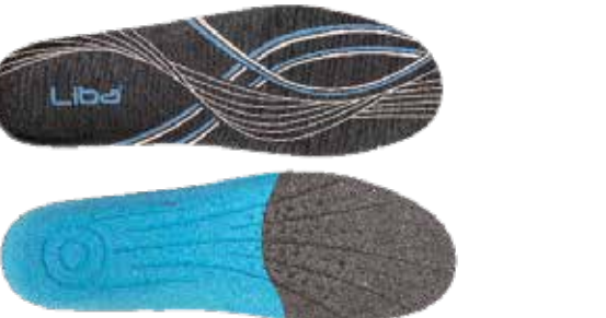
SULA LIBA SPORT 0-9025-1000-10

Tunn och stötdämpande iläggssula i PU-skum för alla typer av aktiviteter. Ger bra stöd och stabilitet. Arneflex skum med öppna celler gör att skon andas, vilket motverkar svett.