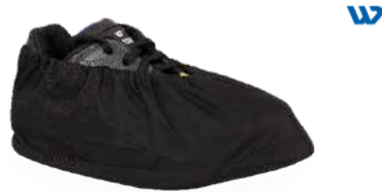
SKOSKYDD TEXTIL WENAAS PAR 0-9400-1300-10

Skoöverdrag i andningsaktiv och hållbar textil Den elastiska övre delen gör den lätt att ta av och på- Halksäker sula. Skyddar mot vatten och smuts. Skon kan tvättas i ljummet vatten och återanvändas flera gånger. Dessa överdrag är därför också ett miljövänligt alternativ.