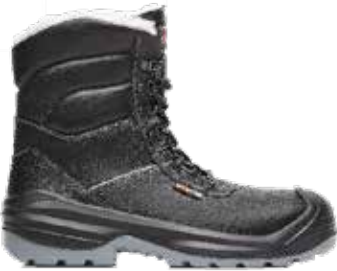
STÖVEL EXENA TORONTO S3 CI 0-1471-1205-10

Pälsfodrad stövel med snörning och blixtlås på sidan. Stöveln upplevs som lätt och rymlig, samtidigt som den håller dina fötter varma och skyddade på vintern. FÄRG 10 Svart STORLEK 35-48 STANDARD EN ISO 20345:2011, S3 CI SRC MATERIAL Överdel: Läder. Yttersula: PU/PU. Spiktrampskydd: Mjukt. Foder: Päls. Tåhätta: Komposit.