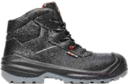
SKOLETT EXENA VICTORIA S3 0-1371-1205-10

Lätt och rymlig skolett med överdel av läder och behagligt innerfoder av textilmaterial. Passar utmärkt för yrken där halvhöga skor krävs. FÄRG 10 Svart STORLEK 35-48 STANDARD EN ISO 20345:2011, S3 SRC MATERIAL Överdel: Läder. Yttersula: PU/PU. Spiktrampskydd: Mjukt. Foder: Textil. Tåhätta: Komposit.