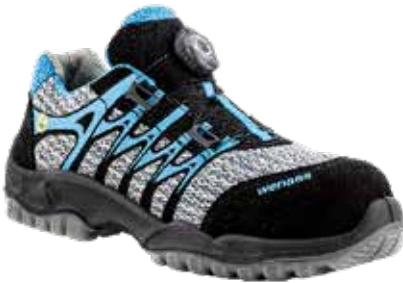
SKO MONZA S1P 0-3300-351-10

Solid och rymlig sko med andningsaktiv textilöverdel. Tuff design och slimmad tåhätta samt lätt vikt gör att den här skon varken ser ut eller känns som en skyddssko när den används.