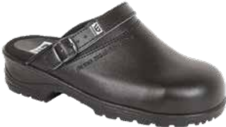
CLOGS MUNIN & HUGIN SB 0-8522-0-10

Klassiska och bekväma clogs med tåhätta och vändbar hälrem. Rymlig modell med ventileringshål i sidan.