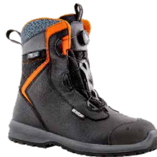
STÖVEL WENAAS BERSERK BALDER S3 0-1420-1101-10

Drop är skillnaden i skosula från framfot till häl och det är viktigt för att t.ex. ge kroppen rätt vinkel och balans, förutom bästa möjliga gång under din arbetsdag. Work Comfort EVO har en drop anpassad för användning i skyddsskor som bärs många timmar varje dag.