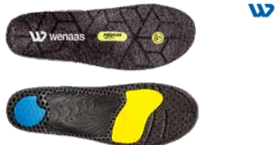
SULA WENAAS WORKPRO MEDIUM 0-9001-1000-98

ESD-iläggssula för statiskt och dynamiskt arbete med anpassning för individuellt fotvalvsstöd. Den här sulan är avsedd för medelhögt fotvalv. Ergonomisk design för att reducera trötthet i fötterna.