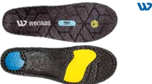
SULA WENAAS WORKPRO HÖGT FOTVALV 0-9002-1000-98

ESD-iläggssula för statiskt och dynamiskt arbete med anpassning för individuellt fotvalvsstöd. Den här sulan är avsedd för högt fotvalv. Ergonomisk design för att reducera trötthet i fötterna.