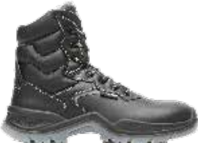
STÖVEL EXENA PHOENIX DRAGKEDJA 0-1472-1205-10

Snörstövel i läder med dragkedja i sidan. Bekväm PU/PU-sula. Lätt, rymlig, metallfri och antistatisk. Komposittåhätta och mjukt nagelskydd. Uttagbar innersula. FÄRG 10 Svart STORLEK 39-48 STANDARD EN ISO 20345:2011, S3 SRC MATERIAL Ovandel: Läder. Yttersula: PU/PU. Nagelbana: Mjuk. För: Textil. Skyddstå: Komposit.