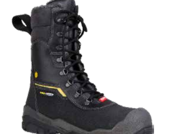
STÖVEL JALAS ICE TRACK S3 0-1808-0-10

En trippelfodrad skyddsstövel med blixtlås och snörning för mycket kalla miljöer. Överdelen i PU-belagt läder skyddar och håller fötterna varma och bekväma hela dagen. Yttersulan av nitril är både olje- och värmebeständig och ger ett bra grepp, medan Jalas® aluminium-tåhätta, plasmabehandlat spiktrampskydd och dubbla stötdämpningszoner av Poron® XRD® bidrar till att förebygga skador.